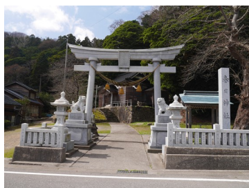
麓に鎮座する春日神社

春日神社に残る木造随神像の脚部裏に大永8年（1528）の墨書で「領主馬繫浦秦恒利左□□」「馬繫浦秦恒利左衛門□□」とあり、馬縹浦一帯を南北朝期か