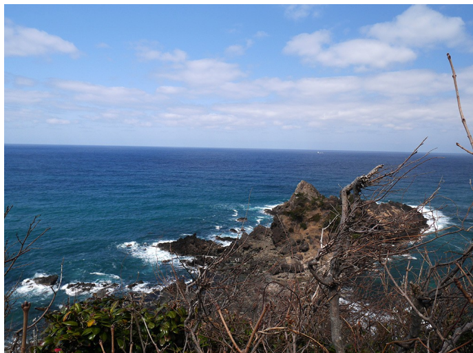
物見台から日本海を見渡す