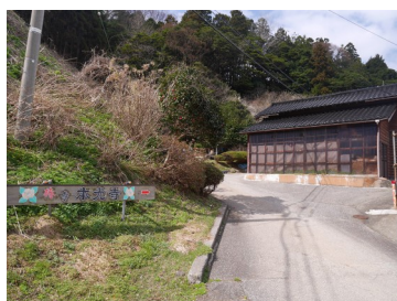
本光寺に向かう登城口

ら戦国期にかけて支配した土豪の恒利（常利）氏が城主と推定されている。春日神社の後背頂部に物見台と考えられる平坦地があり、西側に土塁が残っている。城跡一帯はヤブツバキ群生地のため季節によって視界が遮られるが、間から日本海や馬縹浦を望める。物見台から尾根続きを遮断する2本の堀切を確認できる。本光寺と春日神社本殿に分岐する道路から西に畑地に通じる道が延びているが、入口に浅い凹みが残るので堀切だった場所を深く掘り下げた可能性がある。尾根続きの海側に作られた畑地と本光寺墓地の間にも土塁が確認でき、さらに尾根続きを上がっていくと「ドノイ（殿居）」「オクドノイ（奥殿居）」と呼ばれる緩やかな傾斜地が広がっている。ドノイの北西の尾根続きにも日本海側に土塁が続いている。